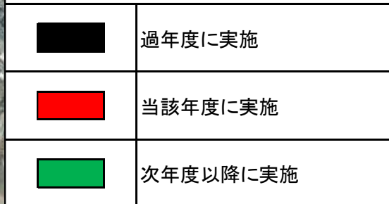
凡例(事業実施年度)