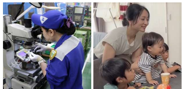
(左)設備オペレーターを務める女性従業員 (右)3人の育休を取得し、働き続ける女性従業員