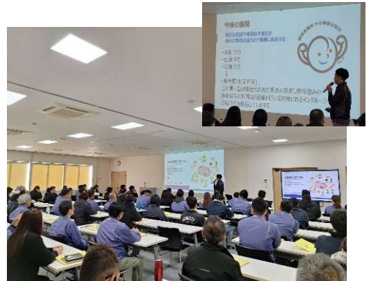
年1度、全員で障がい者雇用の勉強会