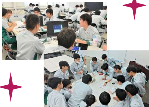
ITスキルやチームワークを磨く新入社員研修