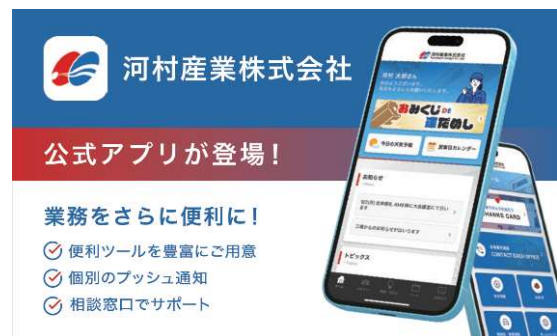
ユニークな機能を搭載した独自アプリ

※性別を問わず、適切な時期に、性や健康に関する正しい知識を持ち、妊娠・出産を含めたライフデザイン(将来設計)や将来の健康を考えて健康管理を行う取り組み(こども家庭庁ホームページより)