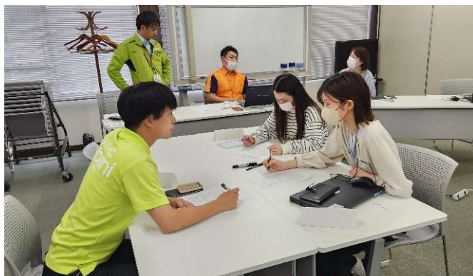
若手社員プロジェクトの打ち合わせ