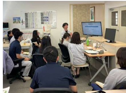
若手のうちから幹部候補の育成