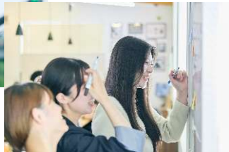
建設部門、企画・営業戦略部門で女性が活躍