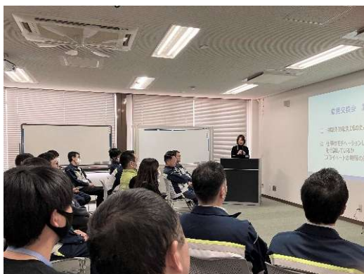
労務研修会で育児支援制度の説明