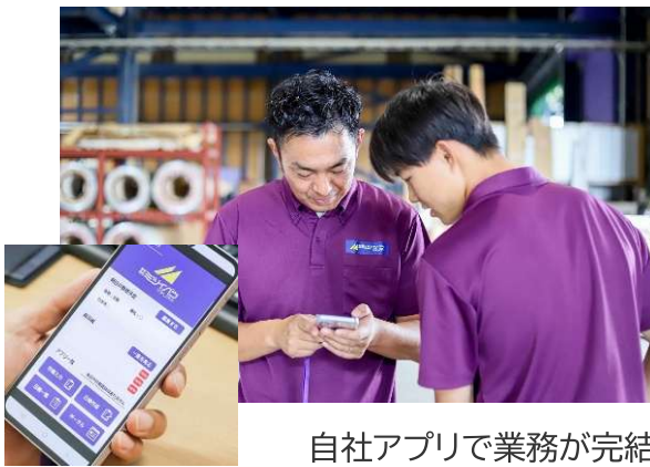
自社アプリで業務が完結