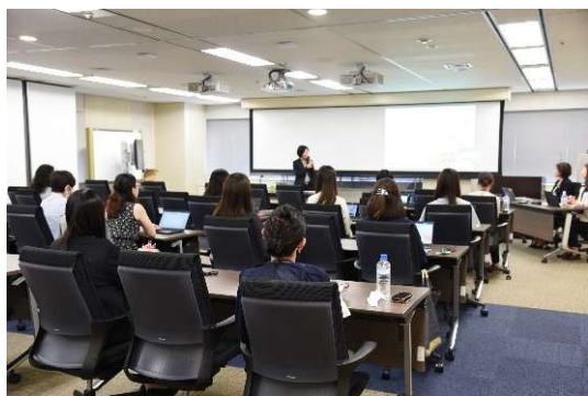
女性活躍に向けた講義