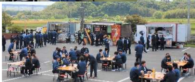
プレコンセプションケア※研修、キッチンカーなど若者を意識した取組