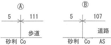
断 面 図