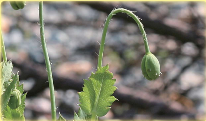
つぼみ (セティゲルム種)