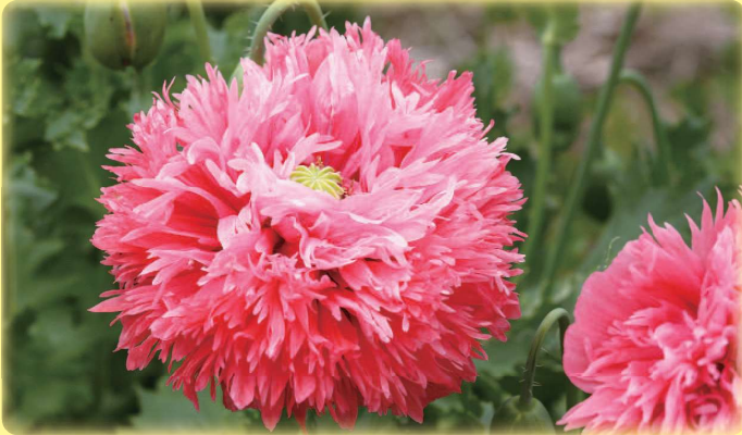
花 (セティゲルム種)

草丈：100～160cm、色：赤、桃、白など 花びら：一重咲き、八重咲き さく果 (けしぼうず)：丸みがある