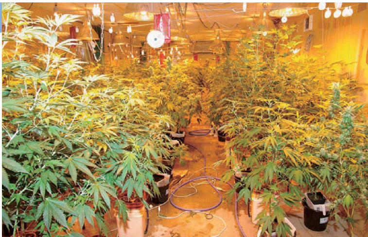
三重県内で不正栽培されていた大麻

大麻の不正栽培についても、法律で禁止されており、そのために許可無く発芽可能な大麻の種子を所持したり、提供したりすることも、処罰対象となります。