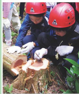
◀ 間伐体験で自分たちが切った木の年輪を数えます。

習を行っています。例えば薪割りや五右衛門風呂焚き! また、伝統的な地域のくらしの聞き取り調査などにも取り組んでいます。