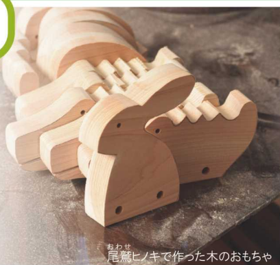
尾鷲ヒノキで作った木のおもちゃ

おおがたさんは、尾鷲ヒノキの間伐材や製材したときに出る余った木（端材）を使って、毎日のくらしで使えるような木製のおもちゃ、スプーンや木べらなどの食器、アクセサリなどの小物を作っています。小物から尾鷲ヒノキの新しい魅力を伝える取り組みです。