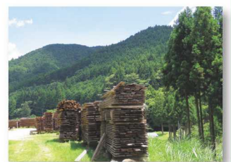
▲山の中の天然の乾燥場

「もりずむ」では、森での林業体験などを通して木のすばらしさを伝えたり、環境のことを考えた木材の使い方を提案する取り組みをしています。また、伝統的な木材の天然乾燥を研究・実践して、木の香りやツヤ、油分などを木に残し、丈夫で虫のつきにくい木材をつくるなど、木の本来の良さを引き出す取り組みも行っています。