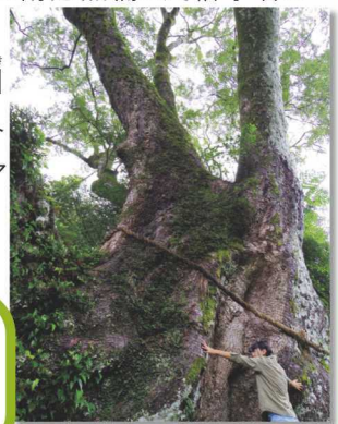
▲幹まわり約15.7m。樹高約31.4m。

御浜町の引作地区にある推定樹齢1500年のクスノキは、明治時代に伐採されそうになったところを博物学者の南方熊楠と民俗学者の柳田國男により守られました。現在は引作地区の皆さんや各地からのボランティアによって大切に保存されています。