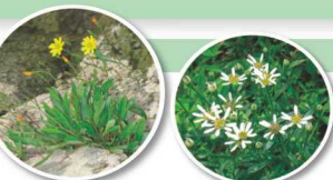
▲ドロシロガナ(左)とキシウギク(右) どちらも紀伊半島にのみ生育する固有種。

御浜町の引作地区にある推定樹齢1500年のクスノキは、明治時代に伐採されそうになったところを博物学者の南方熊楠と民俗学者の柳田國男により守られました。現在は引作地区の皆さんや各地からのボランティアによって大切に保存されています。