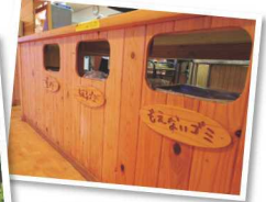
レストランのごみばこ ▲ ▲アトラクション「フラワーワゴン」