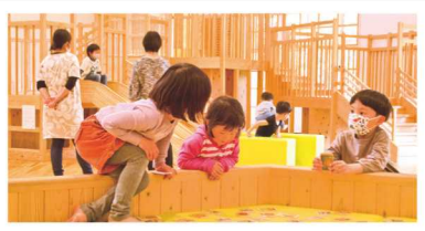
▲みえ森林教育ステーション