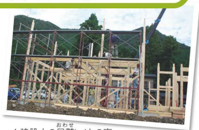
▲建設中の尾鷲ヒノキの家

日本の木材が売れなくなってきていた頃、「このままではいけない!」と地元の林業・製材業・木材加工業の職人が協力して尾鷲ヒノキを使った家づくりを始めました。テーマは「森の見える家づくり」。お客さんに家を建てるところや、実際に森をみてもらうことで尾鷲ヒノキの良さを伝え、伝統の技術を未来に引きつぐ取り組みを続けています。