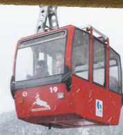
ごさいしょだけ 御在所岳 ロープウェイ

ほくせい 北勢 — 桑名市・いなべ市・木曽岬町・東員町・四日市市 ・菰野町・朝日町・川越町・鈴鹿市・亀山市 —