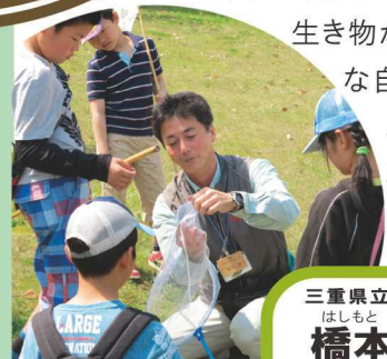
▲昆虫採集と標本作り教室