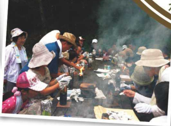
▲炊飯体験 空き缶を使った

かつて地域でもちあがった大規模な開発から赤目の里山を守り育てるため設立されました。「赤目の森」の環境を守る活動や、地域の小学校との里山自然体験授業、日本中・世界中の子どもたちとの環境学習キャンプを行っています。