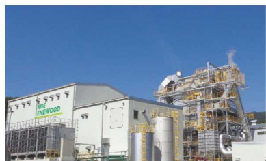
▲木質バイオマスの発電施設

森からは住宅に使える立派な木もたくさん生み出されますが、一方で、材木として利用できない細い木や、製材で出る木くずや余った木などもたくさんあります。そういった木材を無駄にせずエネルギーに変えて、限られた資源をいかしています。