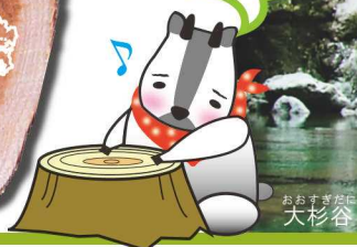
おおすぎだに 大杉谷