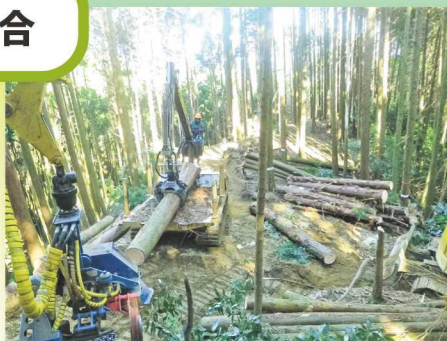
▲伐採した木を運送用車両に積んでいる様子

中勢森林組合では、津市を中心に植林、間伐、伐採など、ありとあらゆる山の手入れや、地域の木材を使った木製品の製作、販売を行っています。他にも、生活に欠かせない森林の役割について知ってほしいという思いから、森のせんせいとして小・中学生に森のはたらきや木を使うことの大切さを伝える活動をしています。