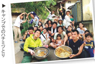
▶ キャンプでのハチミツとり