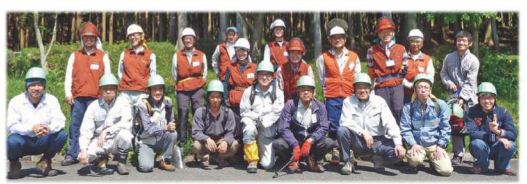
まちのきこり人育成講座 ▶

わたしたちはもともと林業が仕事ではありませんが、森をきれいにし、森にさわやかな風を吹かせたいという思いで活動を始めました。実際に森に来て、木を切るときのチェーンソーの“音”と、木を切り倒す時の“音”を聞いてほしいです。きっと感動するよ！