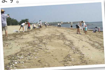
▲香良洲海岸の清掃

森の木は森のある地域にくらす人たちだけが守り育てているわけではありません。雲出川の流域では、下流の海の近くに住む人たちも、川や海でのゴミ拾いのほか、森への植林など、きれいな水を守り、その水を生み出す上流の森を守り育てる活動をしています。