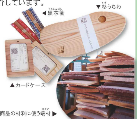
▲カードケース 商品の材料に使う端材▶

「みえもん」では、木材から柱をとった後の余った木（端材）を使わないのはもったいない! と、活用することを考えました。今では「杉うちわ」や「黒芯箸」などの商品を開発して、製作・販売しています。また、地元でとれた材料で地元の人が作ったものや三重県でがんばる人、三重県のすばらしいところを紹介しています。