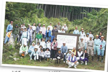
▲美杉町の森での植樹活動