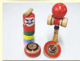
伊勢玩具 サルスベリ・チシャノキ