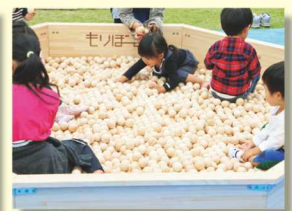
もりぼーる ヒノキ