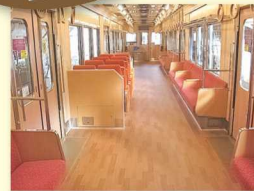
列車 スギ・ヒノキ ナラ・カエデ