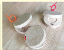
カスタネット クリ