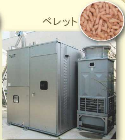
冷暖房用 ペレットボイラー