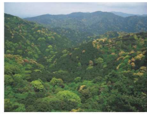
大正末から昭和初期頃の宮域林（ヒノキの植林地）（左） 大きな木がほとんどない時期がありました。 現在の宮域林（右）