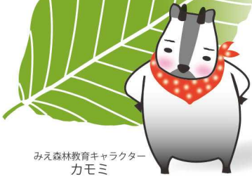
みえ森林教育キャラクター カモミ