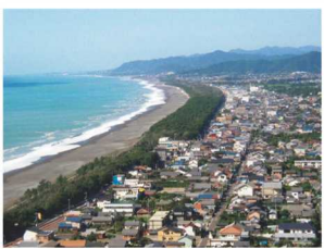
しちりみはま かいがんりん 七里御浜の海岸林