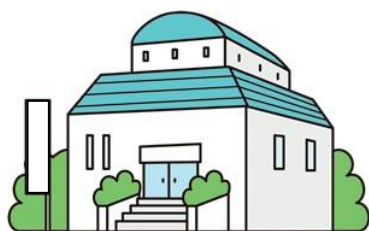
市町村・都道府県・国の機関