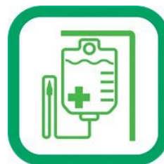
海外での看護活動