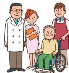
介護保険施設／社会福祉施設