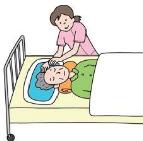
訪問看護ステーション