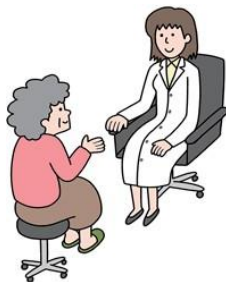
企業の健康管理室