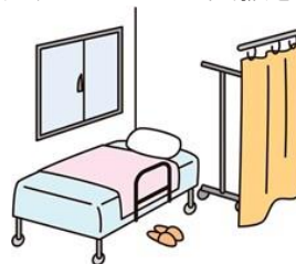
学校および学校の保健室