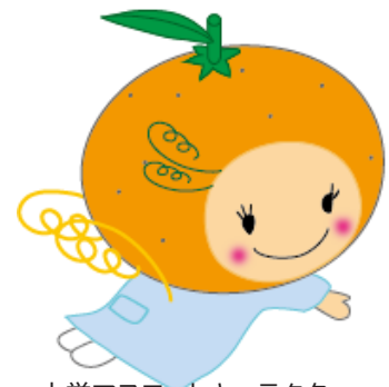
大学マスコットキャラクター 「みかんちゃん」

三重県立総合医療センター、三重大学医学部附属病院、済生会松阪総合病院、伊勢赤十字病院 他