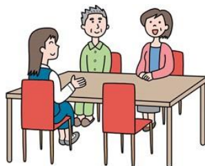
地域包括支援センター