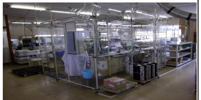
クリーンブース内作業