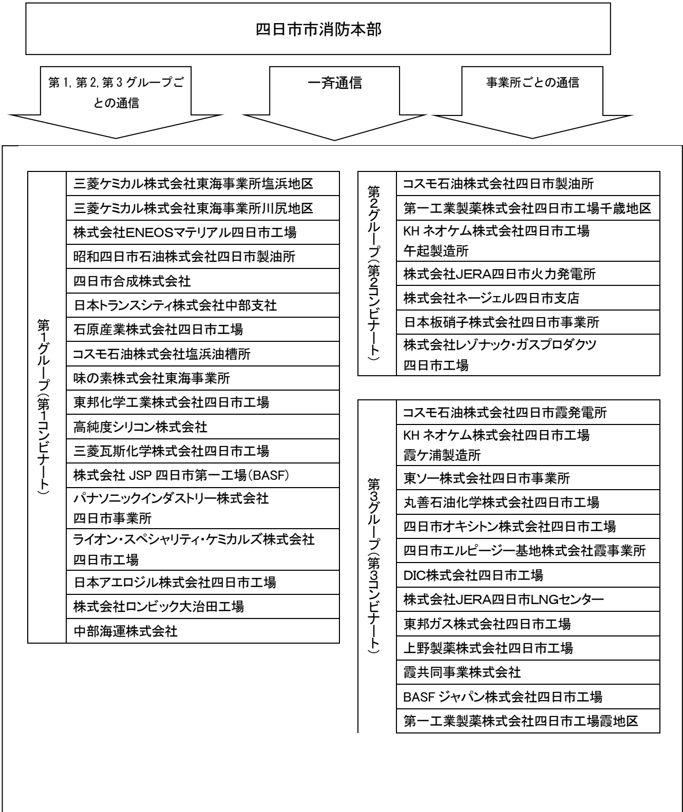
四日市臨海地区 MCA 無線系統図